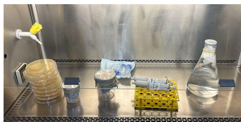
Figura 1: Preparo do inoculo para a aplicação em solo.

Por fim o teste de determinação do índice de supressão (IS) do meio SMSA, onde 10g de solo foram suspensos em 100ml de NaCl acrescidos de 0,5% de Tween 80%, seguido de agitação à 150 rpm por 30 minutos. Alíquotas de 10ul foram depositadas em placas de Petri contendo o meio seletivo.