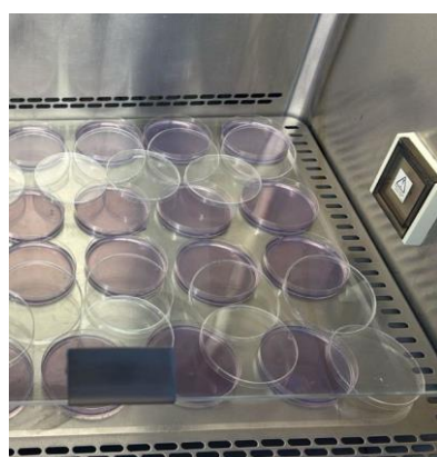
Figura 2: Preparo do meio seletivo para extração de bactérias viáveis do solo.

O experimento foi conduzido em BOD (30°C e UR% 80)