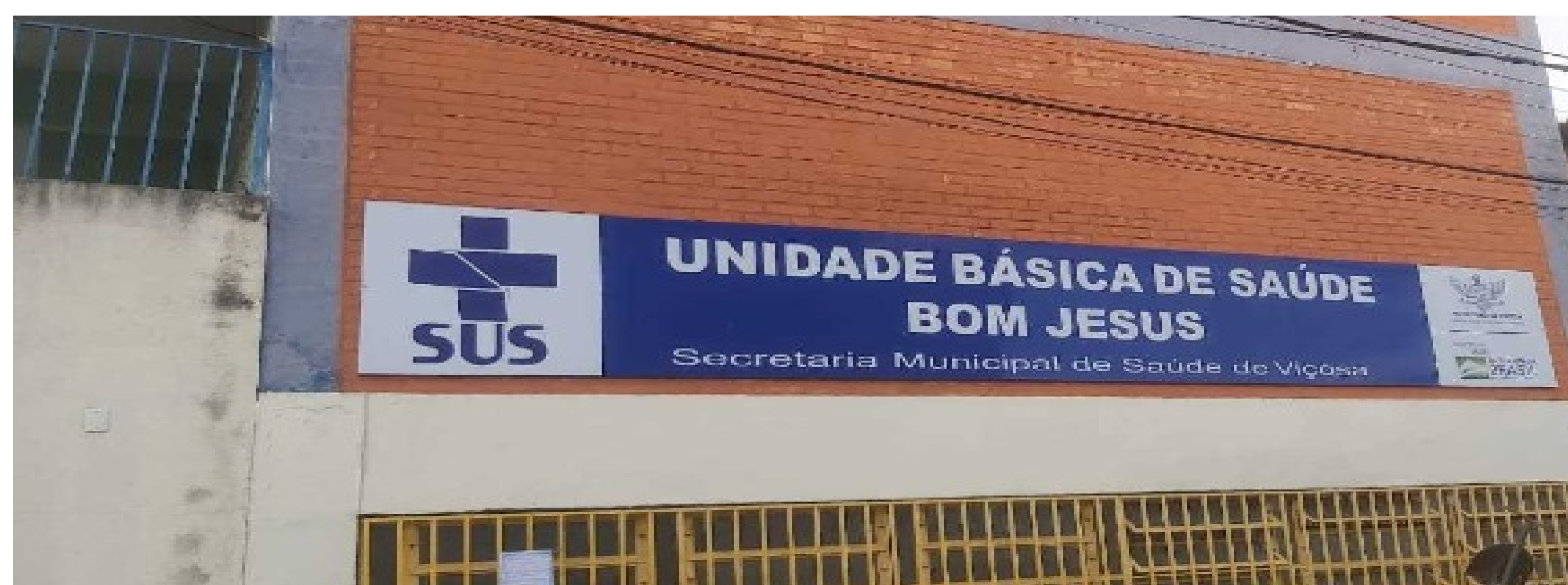
Figura 1- UBS Bom Jesus, na qual foi realizada a atividade.

A proposta nasceu da percepção da equipe de saúde da UBS – médicos, enfermeiros, técnicos de enfermagem e agentes comunitários de saúde – sobre a dificuldade dos usuários em compreender o funcionamento da UBS e o papel de seus profissionais. A partir disso, os estagiários criaram materiais educativos – cartaz e panfletos – com linguagem acessível e recursos visuais didáticos. O cartaz foi afixado na recepção da unidade e os panfletos foram apresentados durante consultas médicas entre os dias 25 de junho e 05 de julho de 2025, com explicações verbais e espaço para esclarecimento de dúvidas. Cópias dos panfletos foram deixadas na recepção para distribuição contínua.