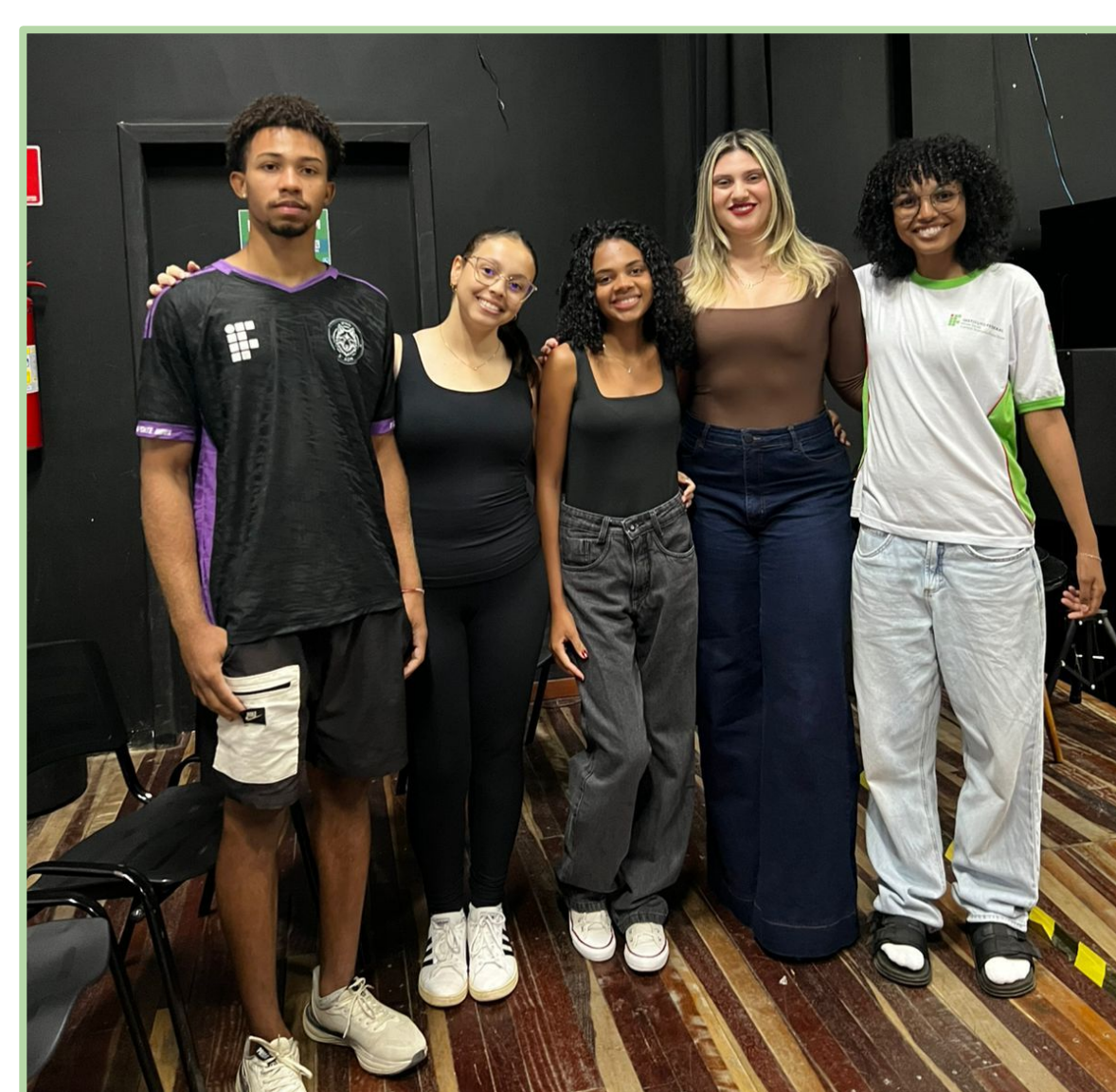
Parceria: CEU das Artes Prefeitura de Ponte Nova