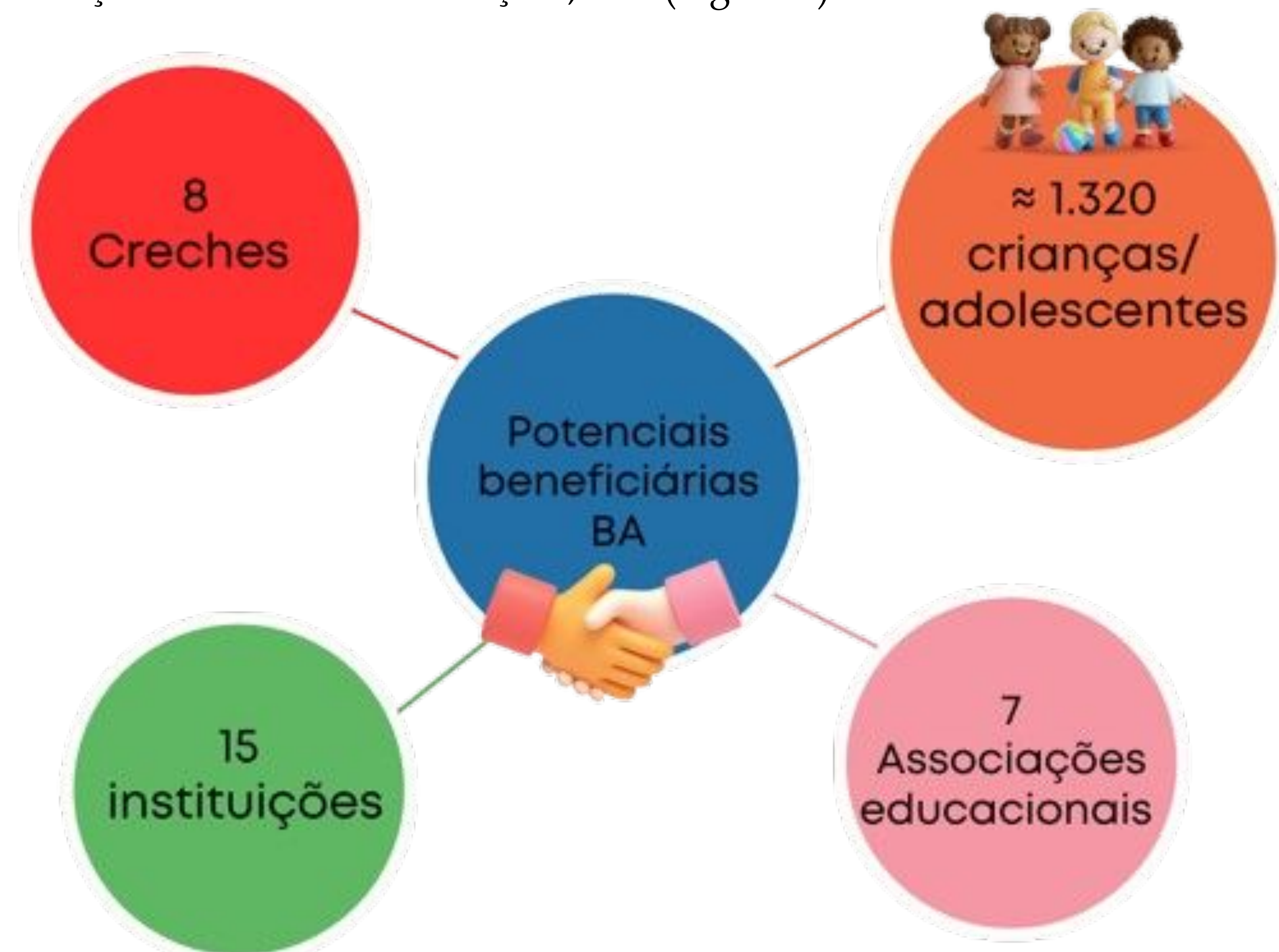
Figura 1: Esquema representativo de instituições educacionais filantrópicas com possibilidade de serem beneficiadas pelo Banco de Alimentos de Viçosa, MG.

Foram identificadas 15 instituições que atendem aos critérios estabelecidos para receber alimentos do BA e contribuir com a SAN de crianças e adolescentes de Viçosa, MG (Figura 1).