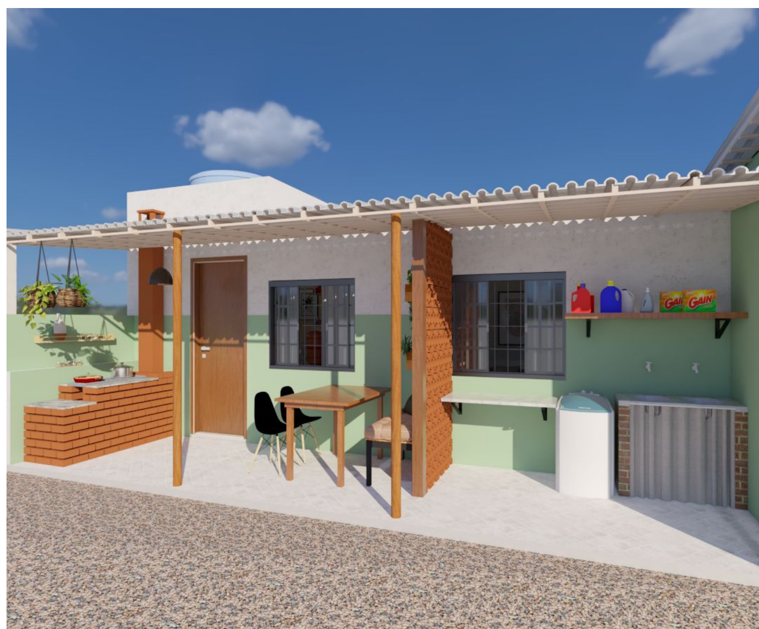
Fig. 5: Proposta de fachada.

Após a realização do levantamento da residência da família de Iara, foi elaborado um projeto arquitetônico completo para a requalificação da residência, com vistas à melhoria das condições de habitabilidade, segurança, salubridade e conforto ambiental, considerando a realidade física, social e econômica da família. Este projeto constitui o projeto piloto do Reabitat. A seguir, apresentam-se imagens renderizadas do projeto.