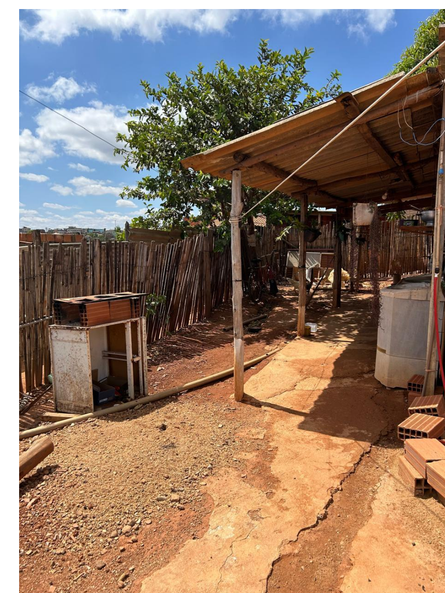
Fig. 2 [Esquerda]: Família da Iara. Fonte: Acervo Reabitat, 2025; Fig. 3 [Centro]: Antiga fachada da casa da Iara. Fonte: Acervo Reabitat, 2025; Fig. 4 [Direita]: Entrada e quintal da casa. Fonte: Acervo Reabitat, 2025.

Após a realização do levantamento da residência da família de Iara, foi elaborado um projeto arquitetônico completo para a requalificação da residência, com vistas à melhoria das condições de habitabilidade, segurança, salubridade e conforto ambiental, considerando a realidade física, social e econômica da família. Este projeto constitui o projeto piloto do Reabitat. A seguir, apresentam-se imagens renderizadas do projeto.