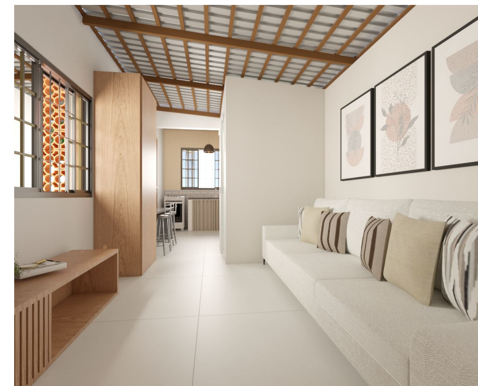
Fig. 6: Proposta de sala.