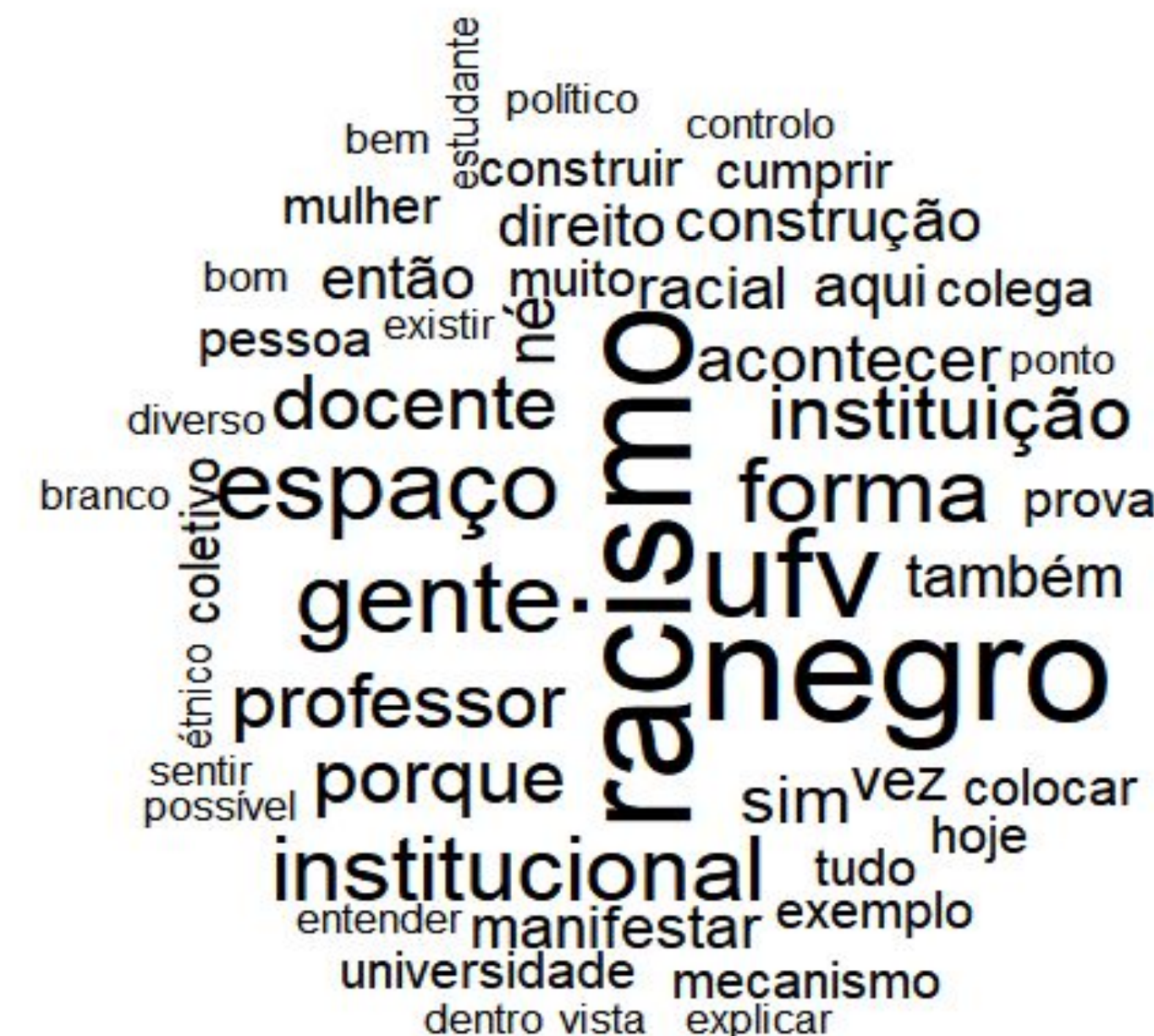
Nuvem de Palavras