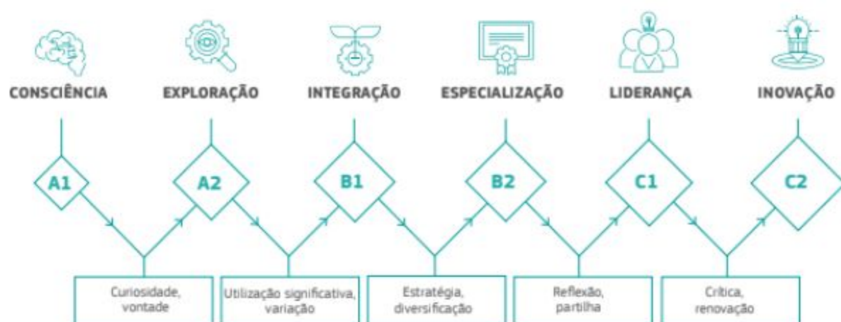
Figura 01. Modelo de Progressão DigCompEdu