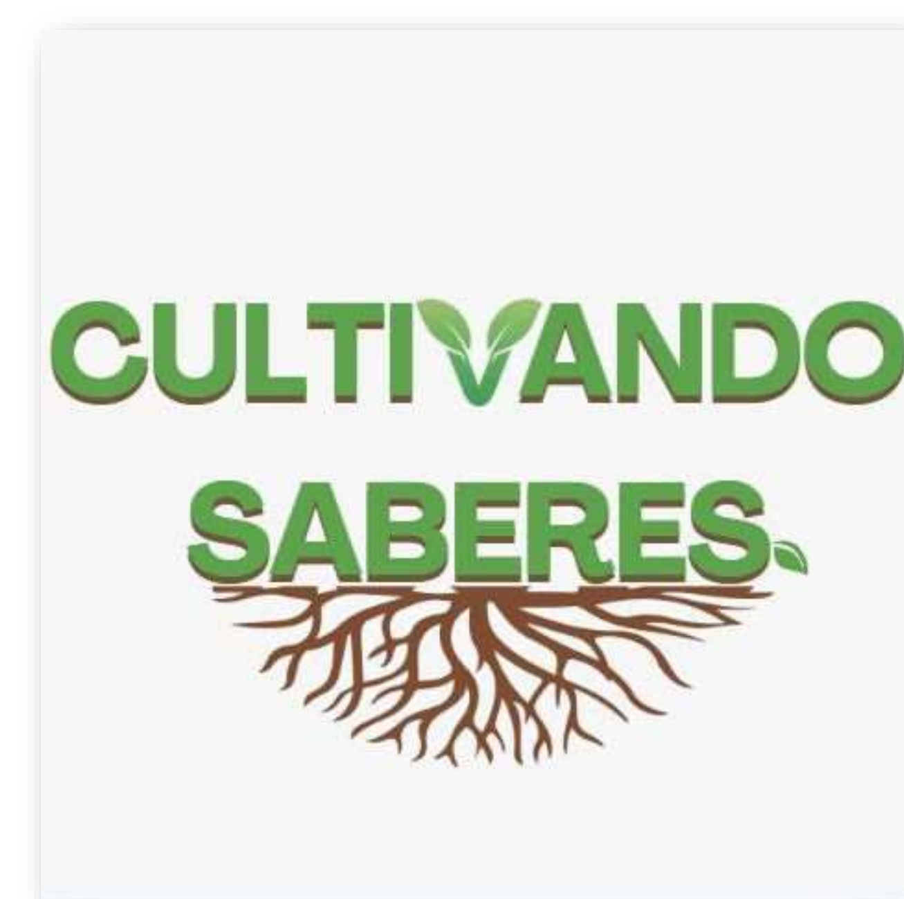
Figura 1 – Logotipo criado para o Projeto "Promoção da Alimentação Saudável e Sustentável: da horta à mesa", DNS-UFV, 2025.

A proposta resultou nas palavras "Cultivando Saberes" na cor verde, com sombreamento na tonalidade marrom, sustentada por uma raiz no formato de ícone triangular invertido por este referir as operações e remeter-se simbolicamente aos 4 elementos da alquimia (Figura 1).