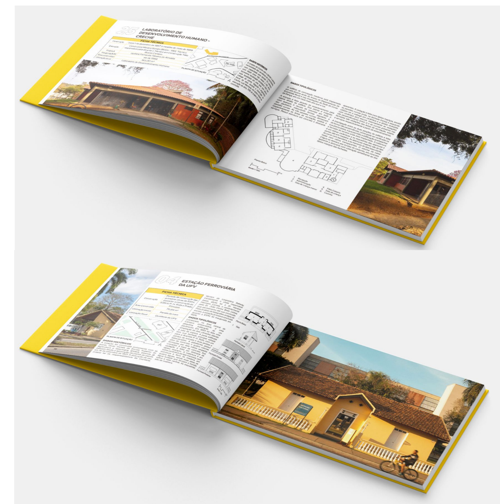
Figura 3 – Prévia das páginas da Creche e da estaçãozinha.