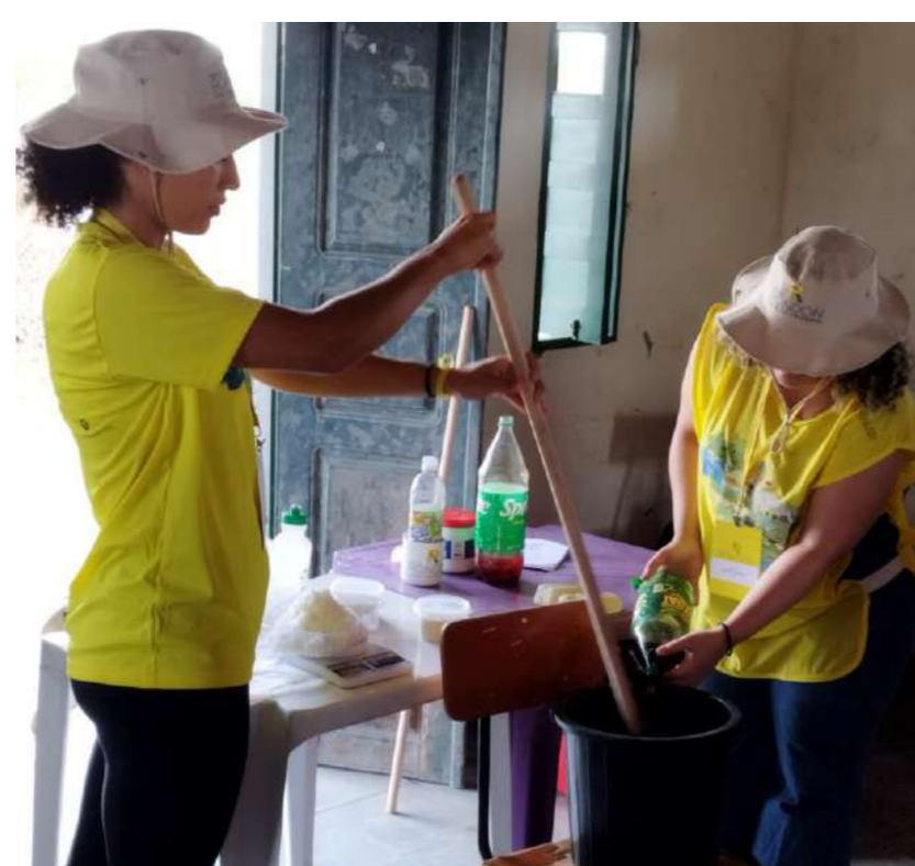
Figura 3: Oficina de produção de sabão caseiro.