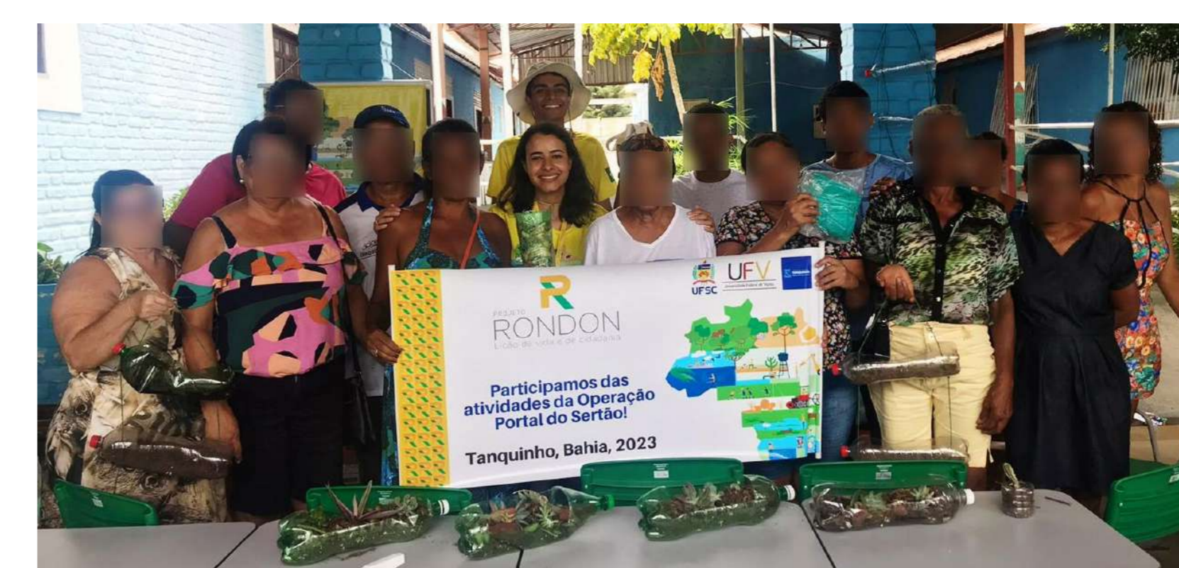
Figura 4: Participantes da oficina de reutilização de garrafa pet para cultivo de hortaliças e suculentas.

Ao final da operação, ficou evidente o quão transformadoras foram as capacitações desenvolvidas para a população atendida e a contribuição das experiências para a formação acadêmica e cidadã dos universitários.