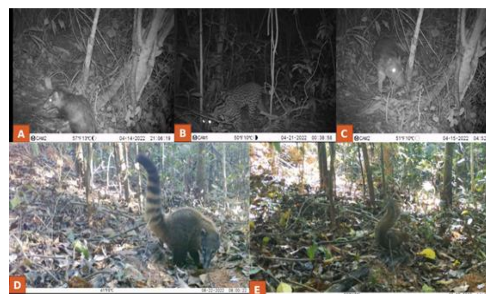
Registros das armadilhas fotográficas