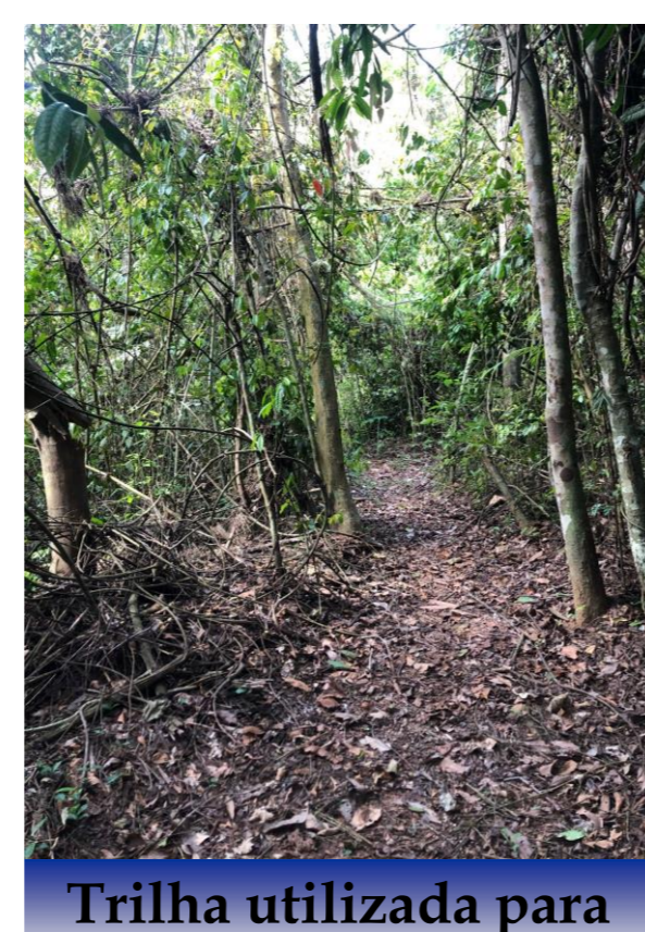
Trilha utilizada para o armadilhamento