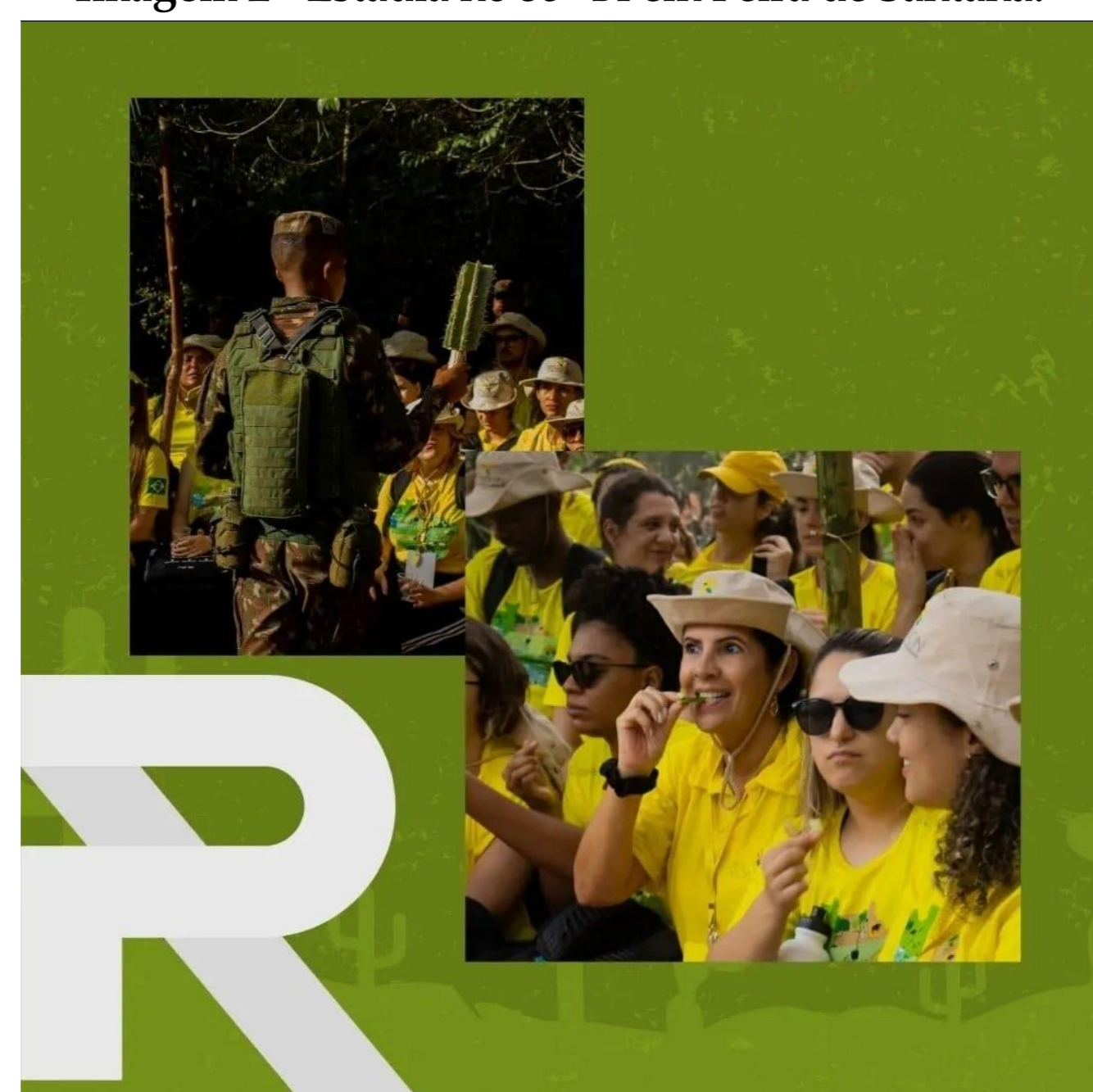
Imagem 2 - Estadia no 35º BI em Feira de Santana.