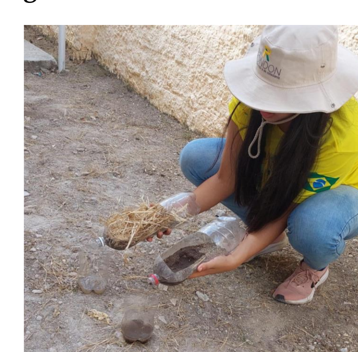
Imagem 4 - Práticas conservacionistas.