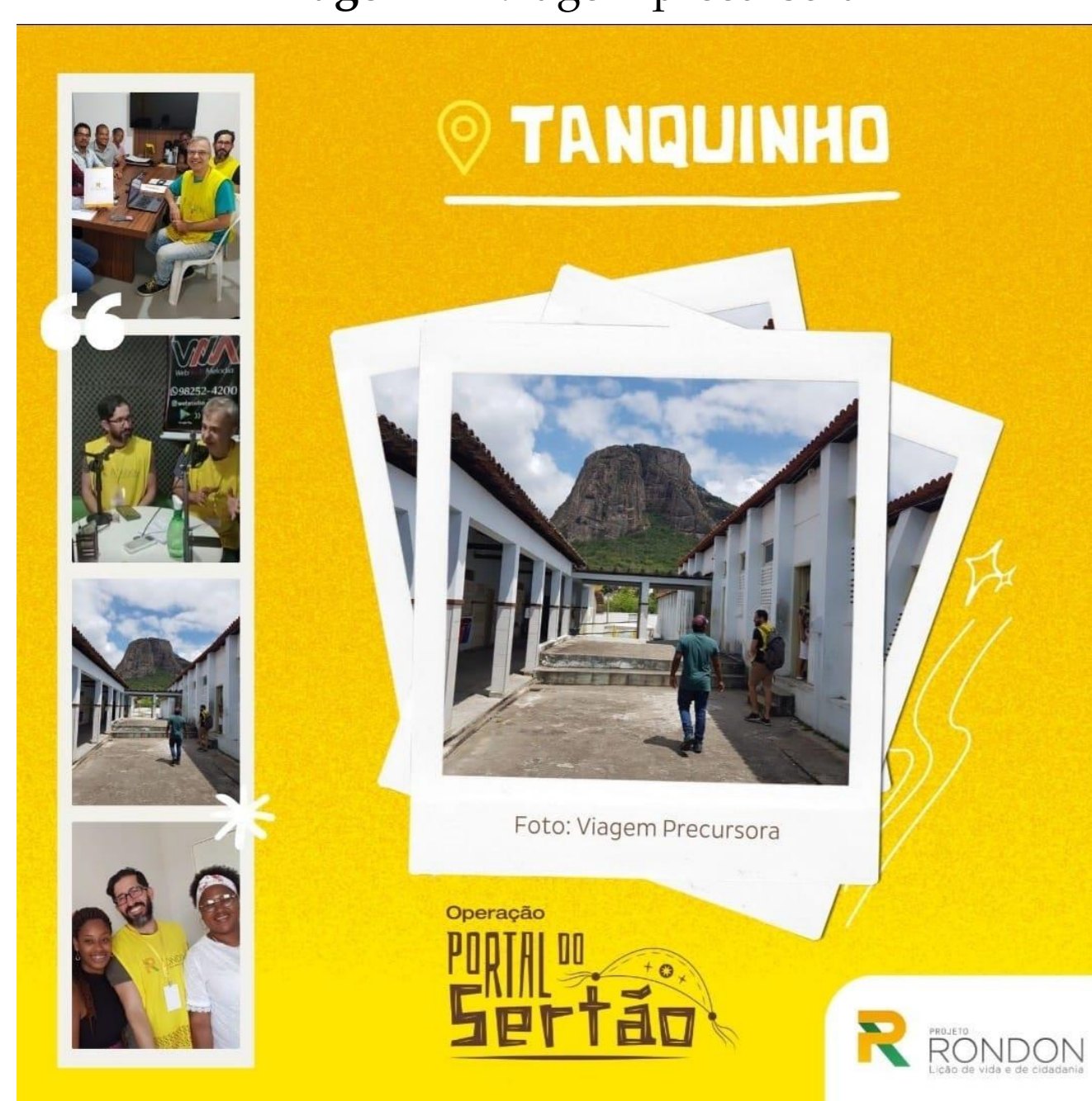
Imagem 1 - Viagem precursora

Durante os 13 dias da Operação Portal do Sertão de 2023, a Universidade Federal de Viçosa representada por oito estudantes e dois professores, desempenhou um papel fundamental na disseminação de conhecimento sobre soluções autossustentáveis no município de Tanquinho, situado na Região Metropolitana de Feira de Santana.