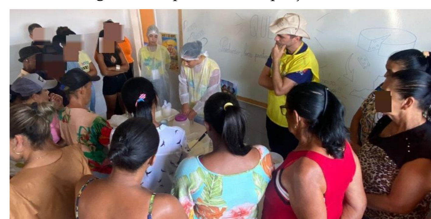
Imagem 3 - Capacitação de queijo fresco.

Foram realizadas as ações de capacitação que incluíram a produção de alimentos fermentados, como vegetais, kombucha, iogurte, kefir e queijo, além de orientações sobre boas práticas na preparação da merenda escolar, implementação de sistemas de tratamento de esgoto e a promoção de práticas de conservação na agricultura. Todas acompanhadas de certificados de participação.