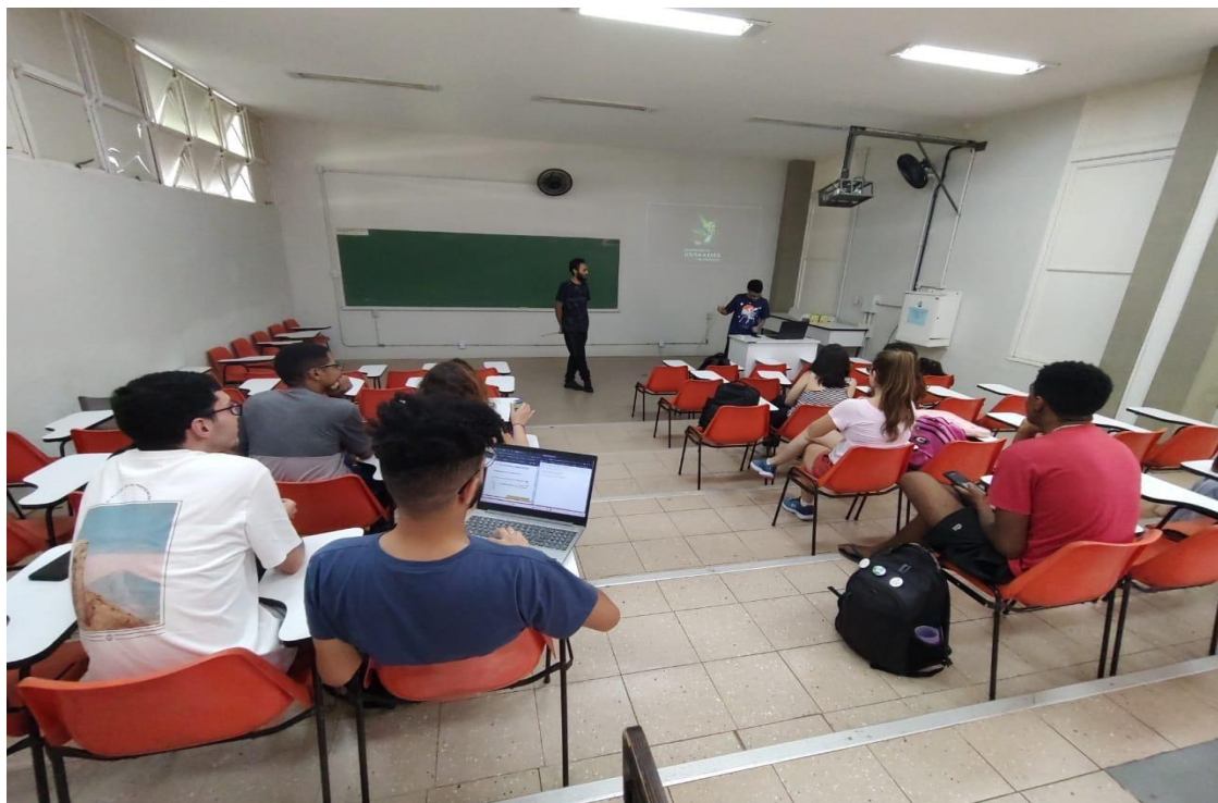
Fig. 1 : Petianos participando da discussão de um artigo.

Discussões em grupo contribuem para o desenvolvimento da oratória e da postura, além de ajudar a controlar a timidez. Como os integrantes do grupo precisam ler ou assistir os filmes e documentários para participar da discussão, esta atividade também amplia a cultura geral do indivíduo.