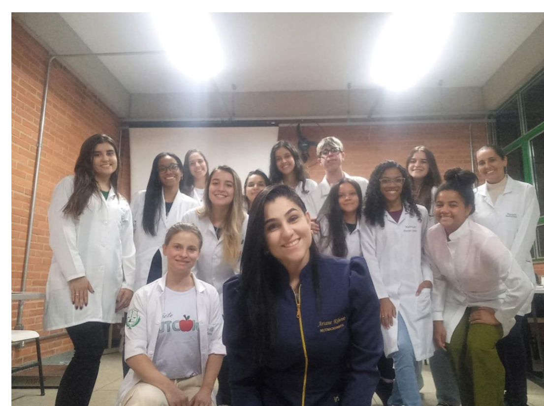
Figura 2 - Mutirão no CAP- Coluni, maio de 2023.

*Termo de Consentimento Livre e Esclarecido