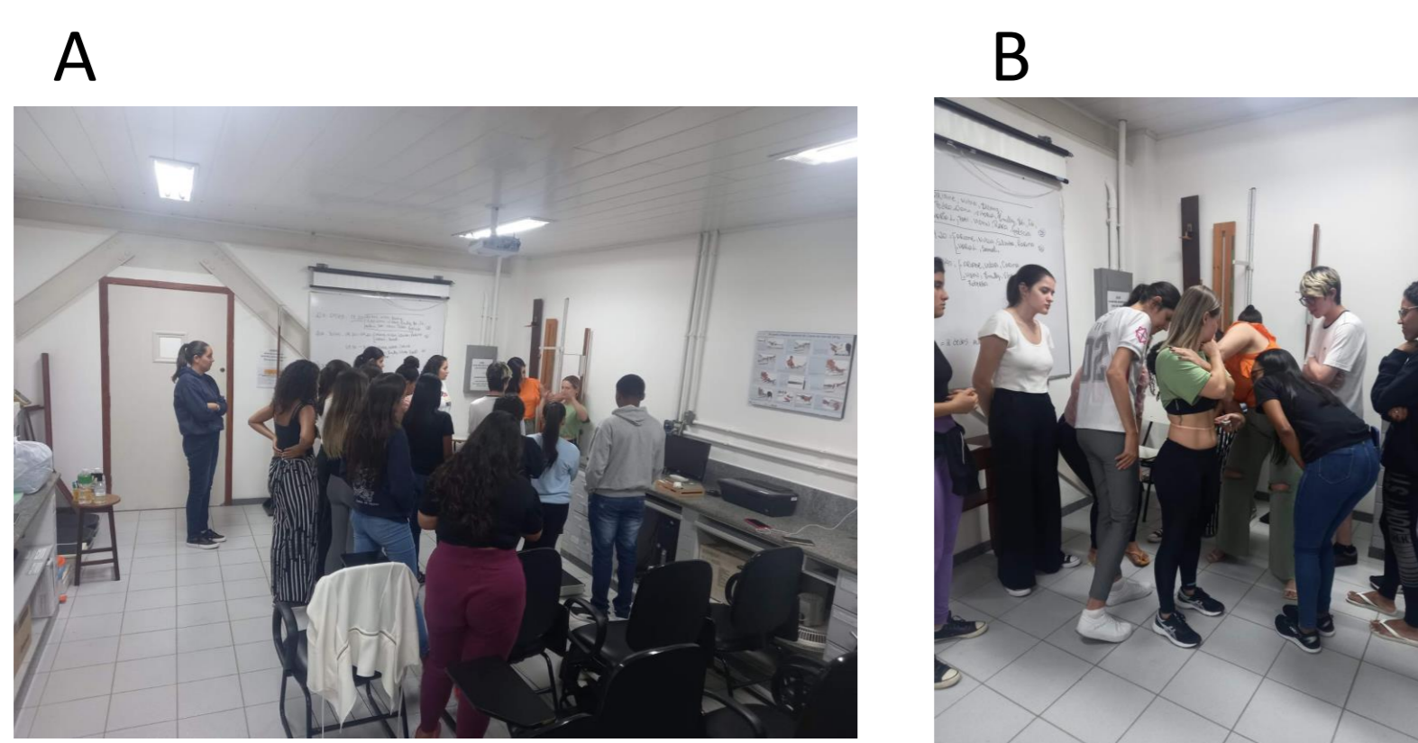
Figura 1 (A e B): Capacitação com os estagiários