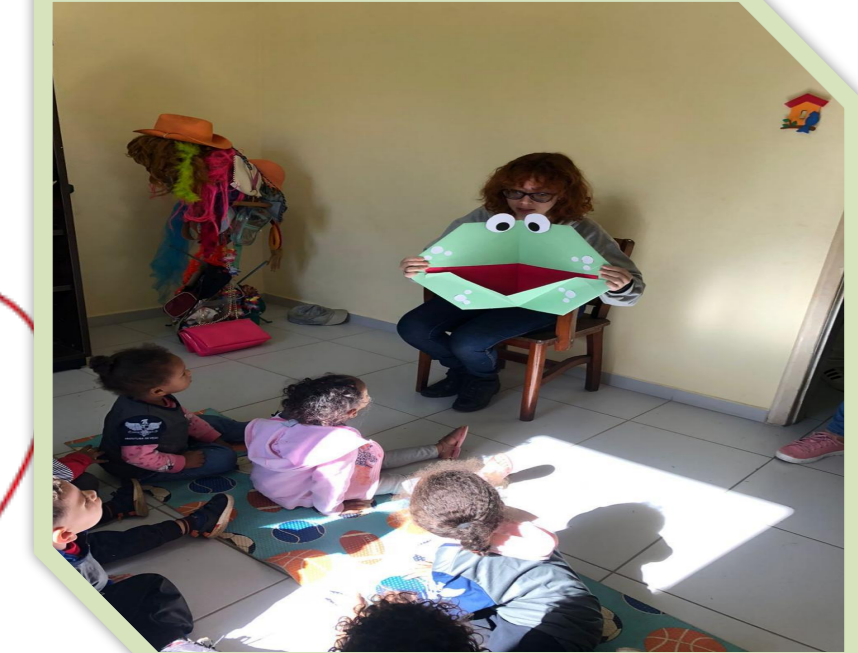
Figura 3 – Atividades realizadas pela equipe com os alunos das escolas