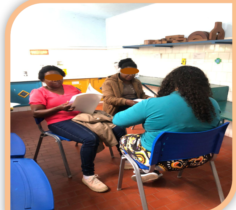
Figura 2 – Oficina com professoras

As oficinas são oferecidas aos professores (Figura 2) que acompanham as suas turmas durante os atendimentos semanais na Ludoteca e é ministrada pela bolsista do projeto, disponibilizando uma apostila impressa que foi elaborada na temática de diversidade. O material fornecido propõe a contação de histórias, atividades artísticas, musicais, jogos cooperativos tendo como enfoque a história “O pato poliglota”, onde são abordadas questões como respeito e compreensão das diferenças. Enquanto acontece esse momento formativo, os estudantes (Figura 3) destes professores realizam brincadeiras acompanhadas pelos estagiários da Ludoteca.