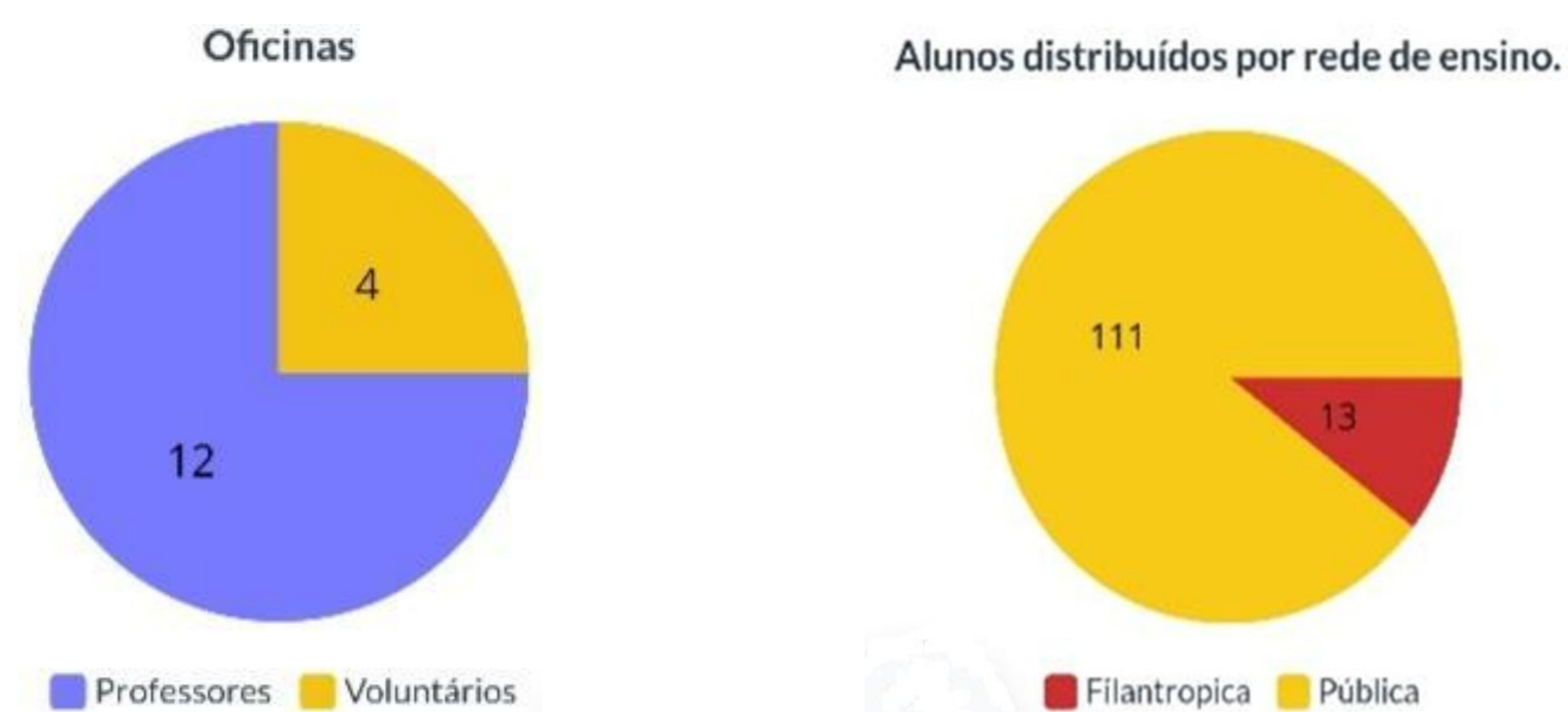
Gráfico 1: Participantes e atendimentos

O trabalho de mobilização junto aos professores possibilita que estes tenham mais interesse em desenvolver uma “exploração criativa” com seus educandos (MENDONÇA, 2008). Até o momento quatro escolas foram atendidas, sendo que uma delas retornou três vezes com diferentes turmas da Educação infantil, atendendo no total 12 professoras (Gráfico 1) e 124 crianças atendidas pela equipe.