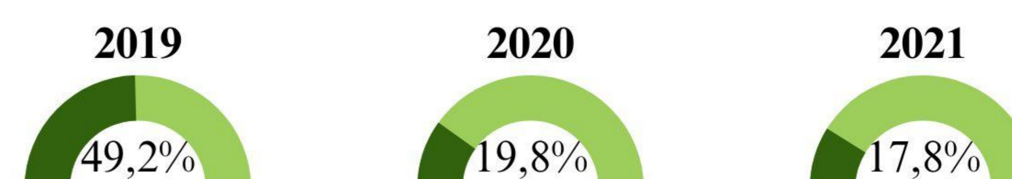
Figura 1. Frequência em que a meta de aquisição da agricultura familiar foi alcançada nos municípios ao decorrer dos anos