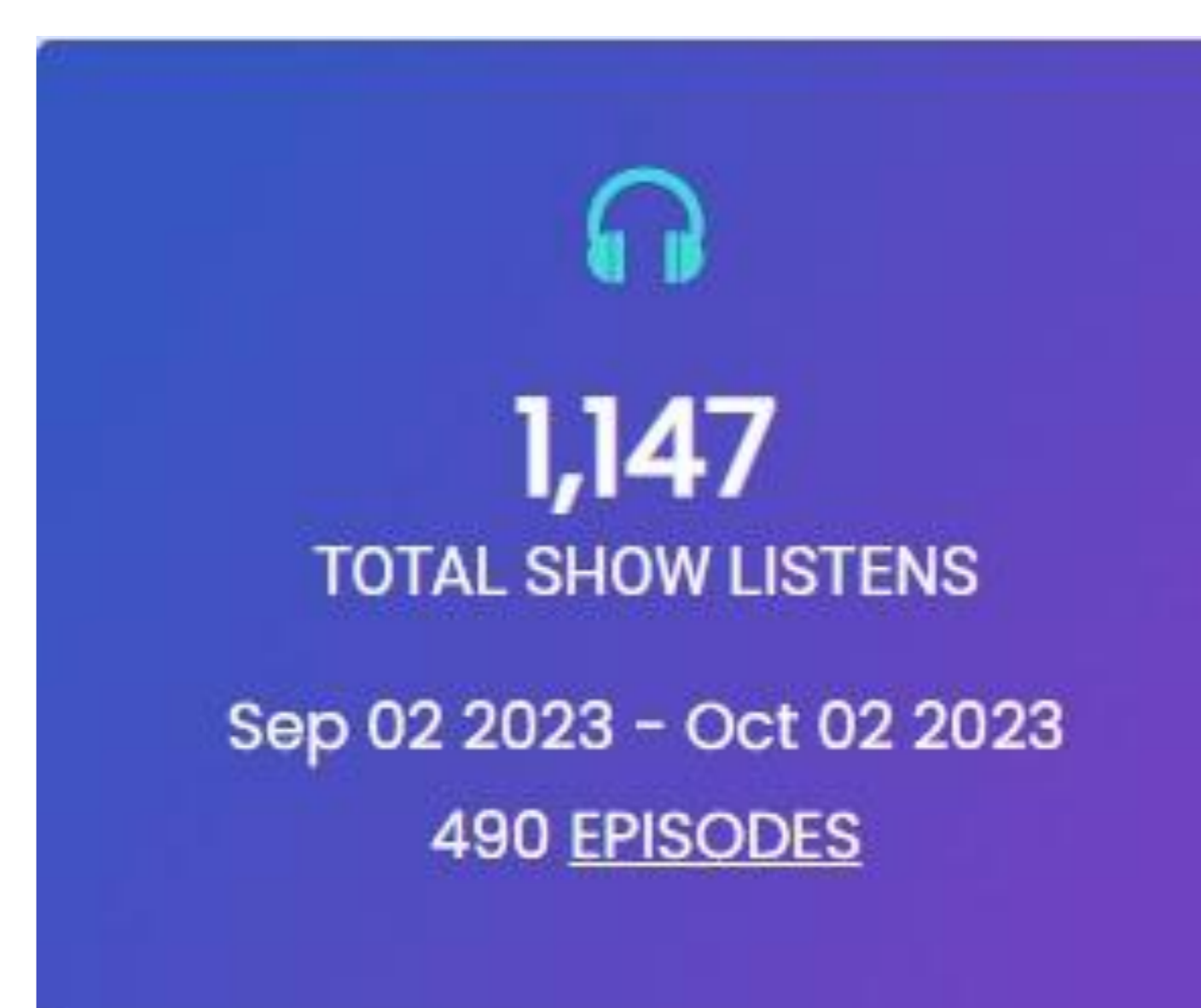
Figura 2: Número total de episódios lançados até o momento e total de ouvintes entre os meses de Setembro e Outubro de 2023.