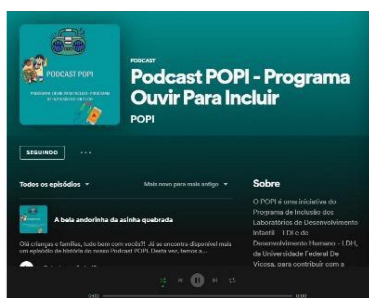
Página no Spotify

O projeto teve como objetivo geral criar um programa lúdico semanal em formato de podcast como instrumento metodológico para promover a inclusão social e cultural e contribuir para o desenvolvimento integral de bebês, crianças e famílias atendidas no LDI e no LDH, bem como da comunidade viçosense em geral no contexto da pandemia do covid-19.