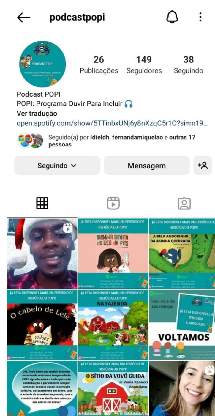
Página no Instagram