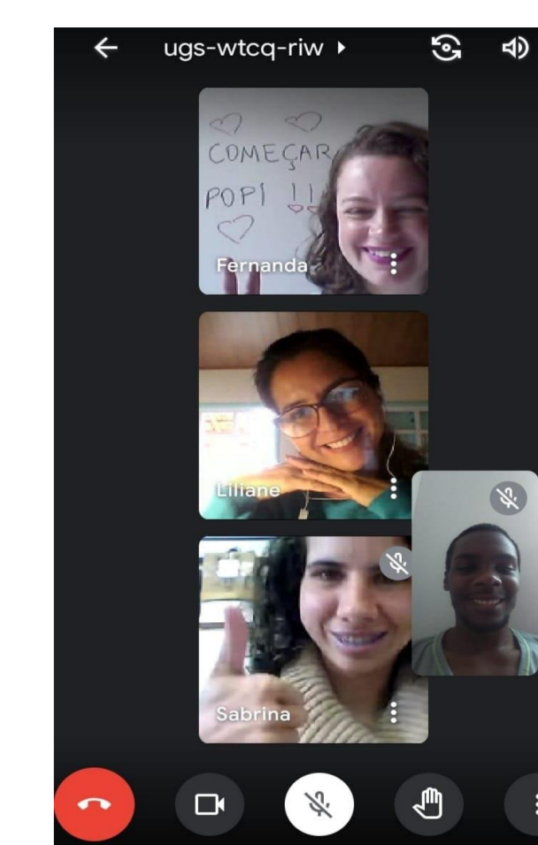
Reunião de equipe POPI