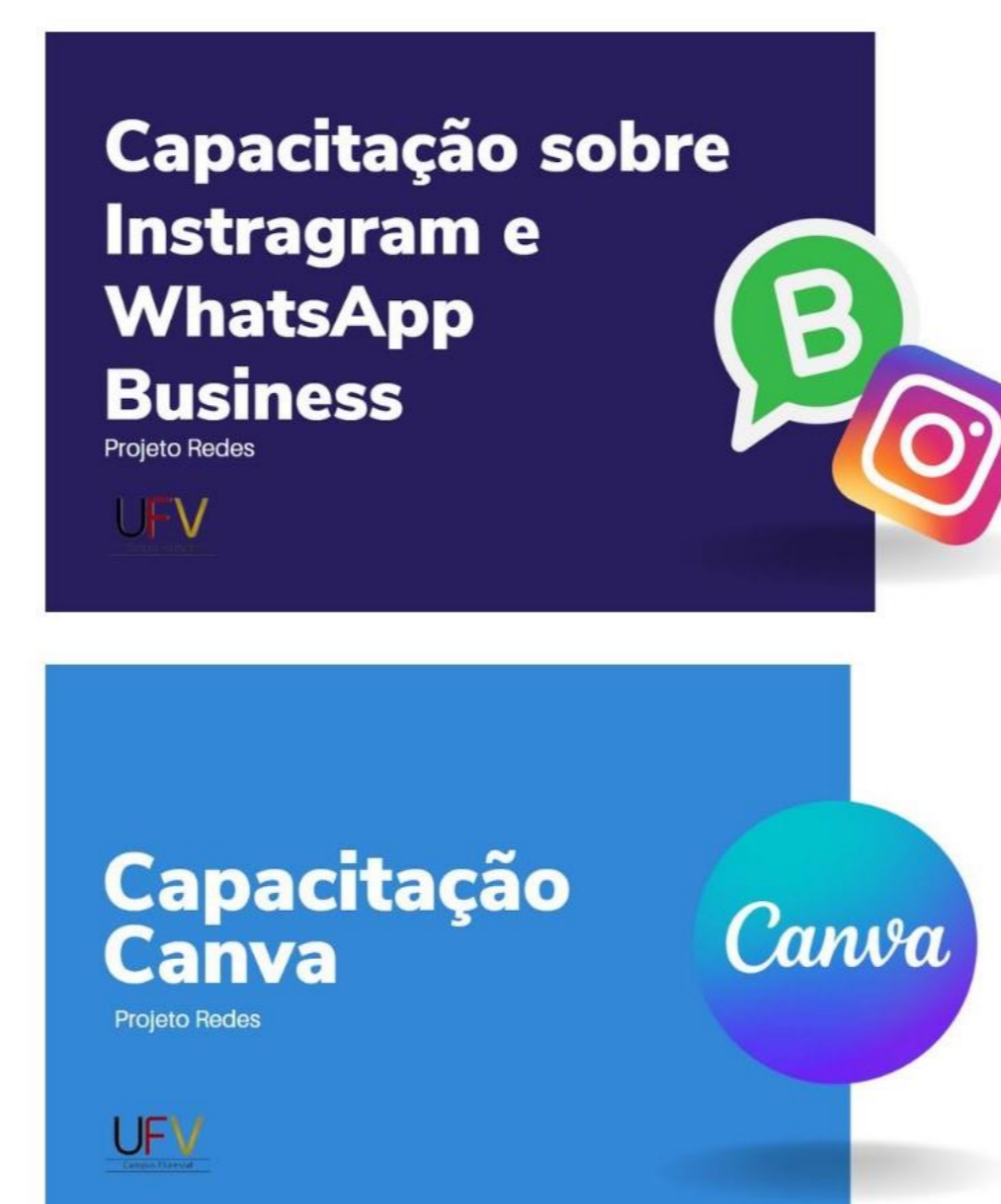
Imagem 1 - Capas das capacitações oferecidas

Trabalhamos com 5 famílias de maneira completa, sendo então desenvolvidos para estas: tabelas nutricionais, guia de rotulagem e capacitações. A partir do formulário de satisfação, os produtores relataram que sentem mais controle sobre a comunicação com seus clientes e mais independência ao usar ferramentas digitais para a ampliação de seus negócios. Além disso, com o cálculo das tabelas nutricionais e guias de rotulagem, as famílias entenderam a importância de terem seus produtos adequados à legislação vigente, para um comercialização mais segura e com maior poder de expansão.