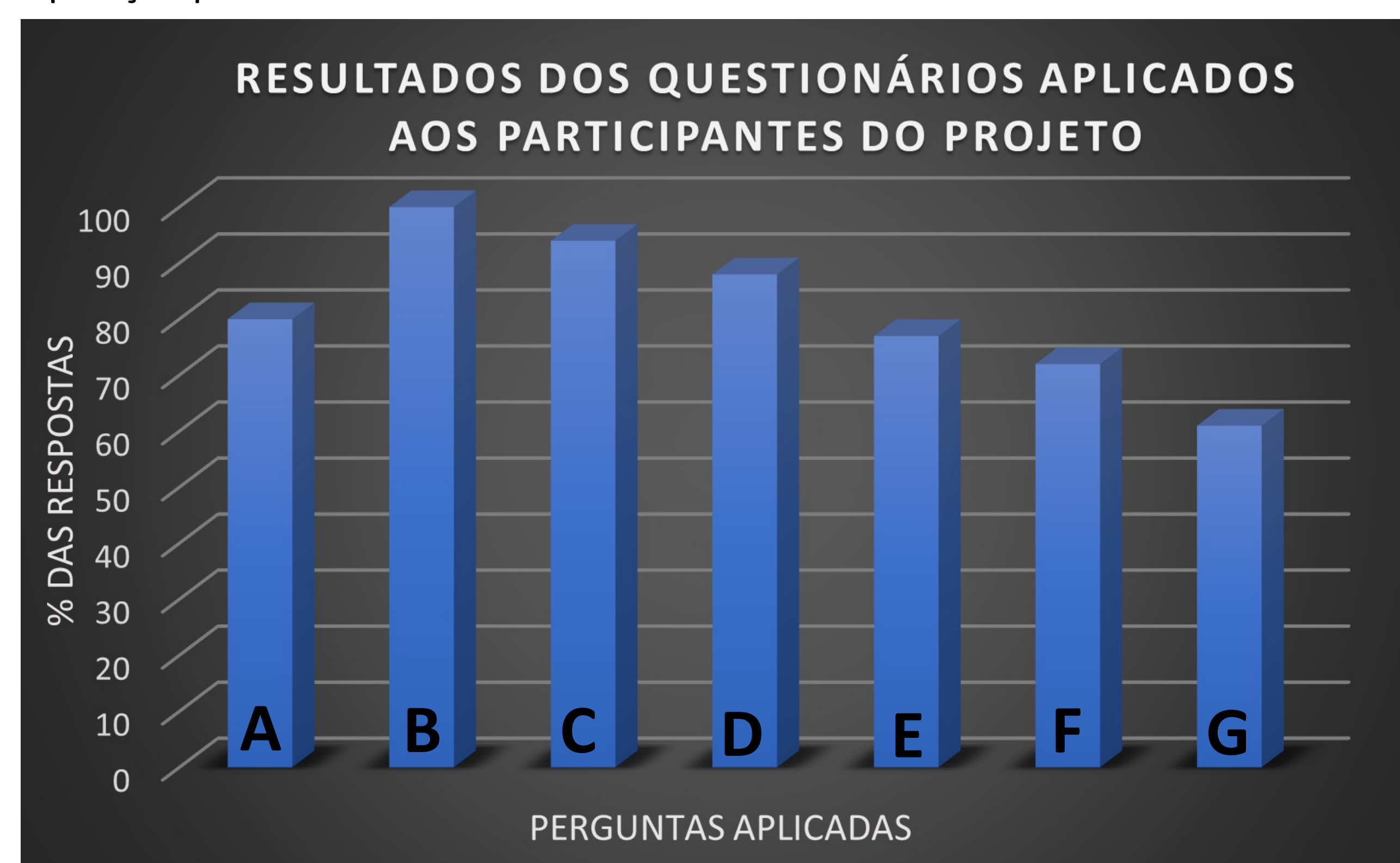
Gráfico 1- Resultados dos questionários aplicados aos participantes do projeto equitação para todos.

Diante das perguntas aplicadas, A :83% dos participantes nunca haviam participado de projetos de interação entre a UFV e sociedade anteriormente; melhoraram o humor, se sentiram mais felizes e melhoraram relações interpessoais; B :100% consideraram relevante a idealização do projeto e adequada a metodologia aplicada; C :94% consideraram que a prática da equitação promoveu maior concentração, disposição, condicionamento físico e postura; D :88% consideraram que evoluíram a prática da equitação ao longo das aulas; E :77% consideraram que a equitação promoveu melhoria em atividades cognitivas; F :72% relataram que o projeto promoveu redução de estresse e aumento de autoconfiança; G :61% apresentaram melhoria na qualidade do sono e aumento de desempenho no emprego e escola/faculdade.