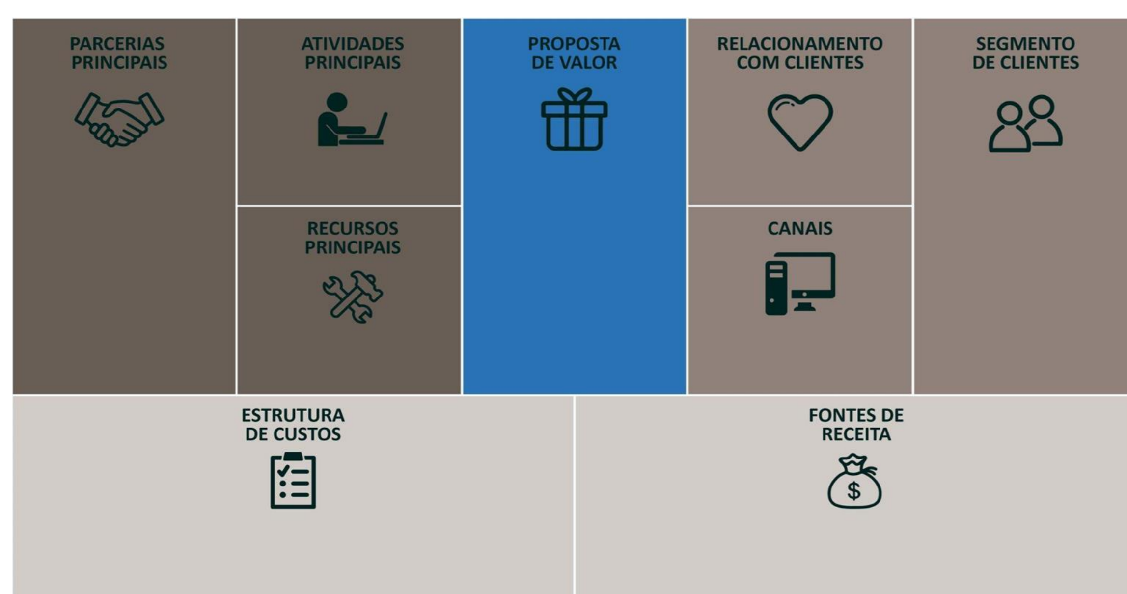
Figura 1. Business Model CANVAS

A pesquisa utilizou dados primários coletados durante os dois primeiros períodos remotos (PER 1 e PER 2) na disciplina de Economia Rural. Foi ministrado conteúdo teórico idêntico em ambos os semestres, porém no segundo houve a realização de atividades envolvendo o CANVAS. Ao final de cada semestre foram coletadas duas variáveis de interesse utilizando a Escala Likert: percepção dos estudantes sobre a motivação ao cursar a disciplina e sobre sua aprendizagem. Para verificar se houve diferença estatisticamente significativa entre as variáveis, foi realizado o teste não paramétrico Mann-Whitney. Participaram da pesquisa 126 estudantes, sendo 60 no PER 1 semestre e 66 no PER 2.