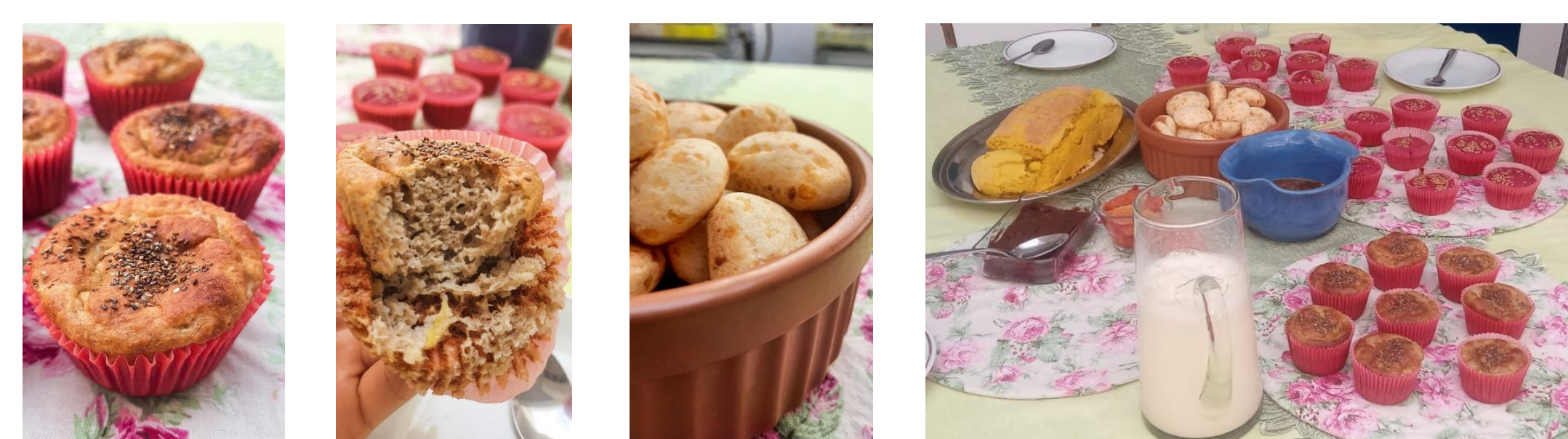
Fotos da Oficina Culinária desenvolvida no dia 06/08/2022

As atividades presenciais permitiram promover a capacitação de mulheres de Viçosa e região para a comercialização de preparações culinárias saudáveis, sustentáveis e seguras, que geram renda e promovem o empoderamento feminino.