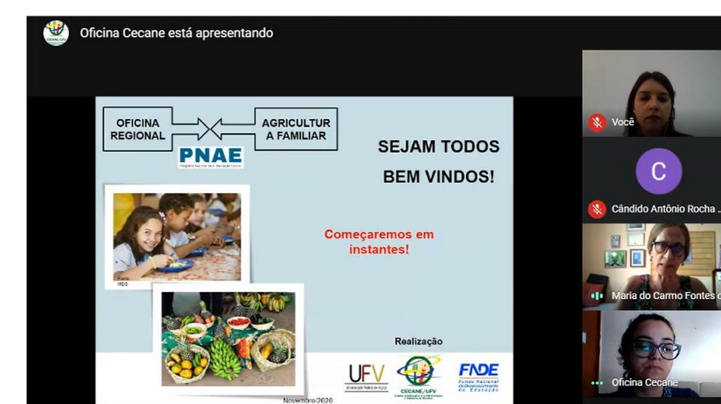
Figura 2 - Oficina II realizada para os municípios selecionados da região intermediária de Juiz de Fora-MG.

Foram realizadas quatro oficinas virtuais nas quais foi constatada a participação de 84 municípios e 211 participantes.