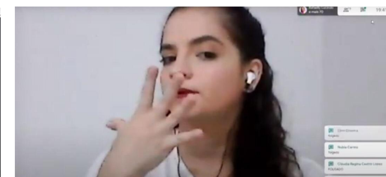
Figura 2 - Minicurso de Libras Básico II.