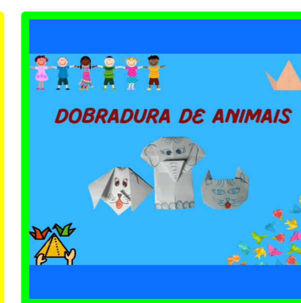
Dobradura de animais com papel