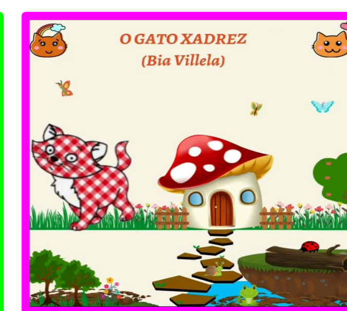
Contação de história: O gato Xadrez