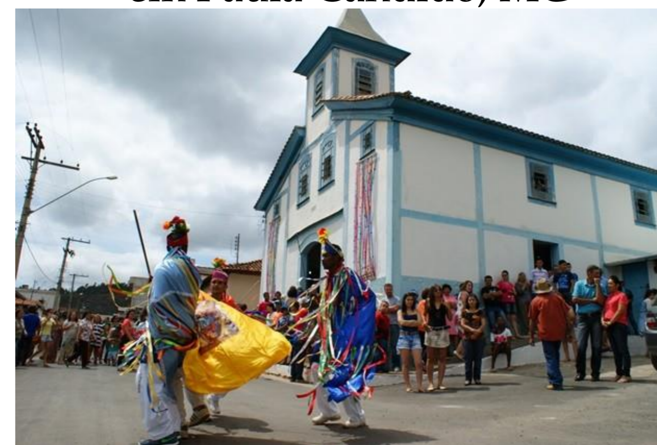
Igreja do Rosário e grupo de congo em Paula Cândido, MG

Verificou-se que o congado, as Irmandades, as Igrejas de Nossa Senhora do Rosário e suas festividades perduram principalmente na cultura das regiões de Minas Gerais. Eles remetem à história e memória dos povos negros e afrodescendentes, sendo muito mais que formas de simbolismo, tradição e religião. Também, afirmam a identidade afrodescendente, resgatam e proporcionam à sociedade um melhor conhecimento a respeito das tradições da cultura dos povos negros. Com isso, devem ser respeitados e valorizados.