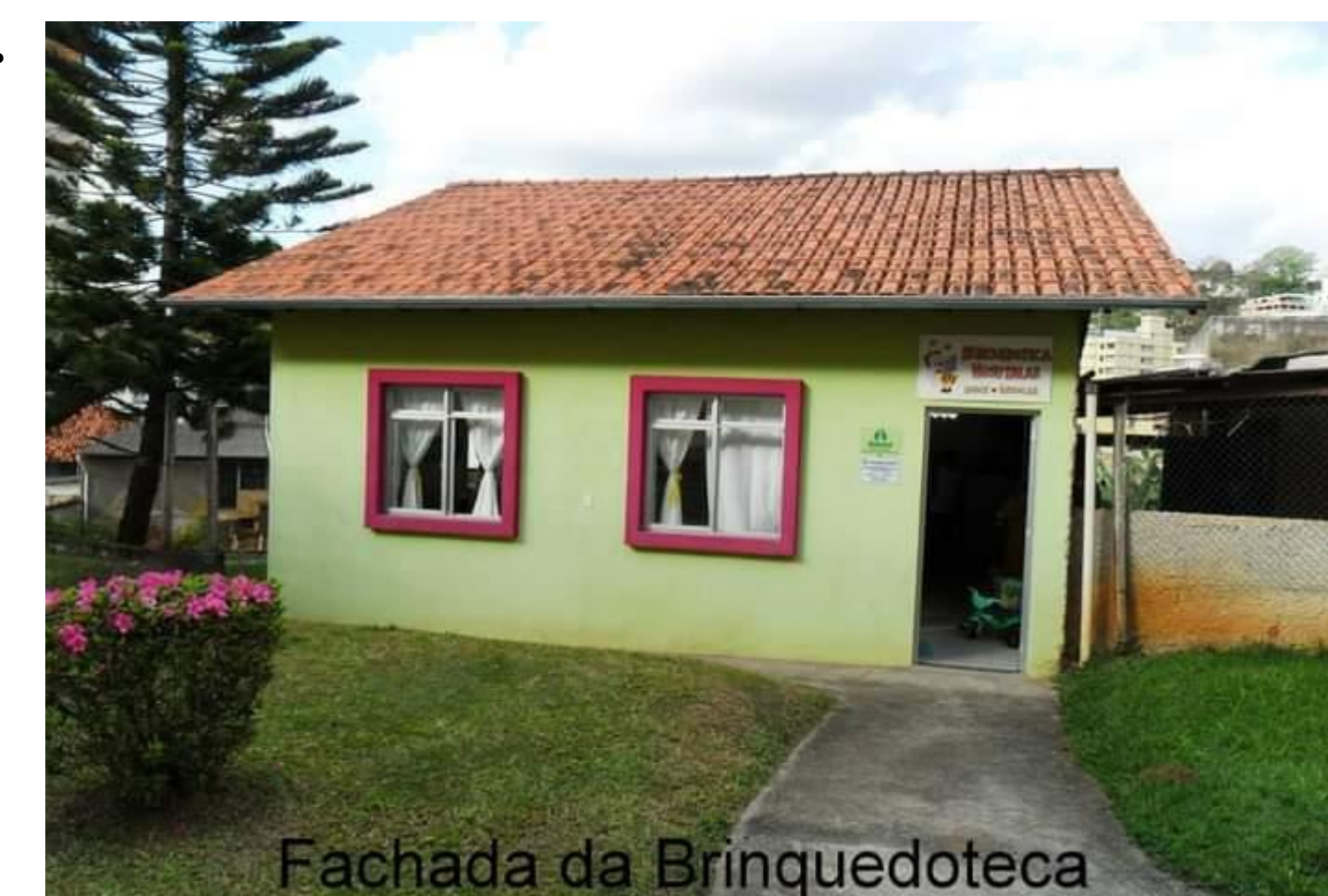
Fachada da Brinquedoteca

A equipe do HSS tem nos mantido cientes do quanto o projeto tem feito falta para as crianças e como está sendo difícil a reabilitação destas sem a possibilidade de utilizar o espaço da brinquedoteca. Diante destes relatos concluímos a importância do projeto para uma melhor recuperação das crianças e esperamos um breve retorno para reabrirmos nossas portas.