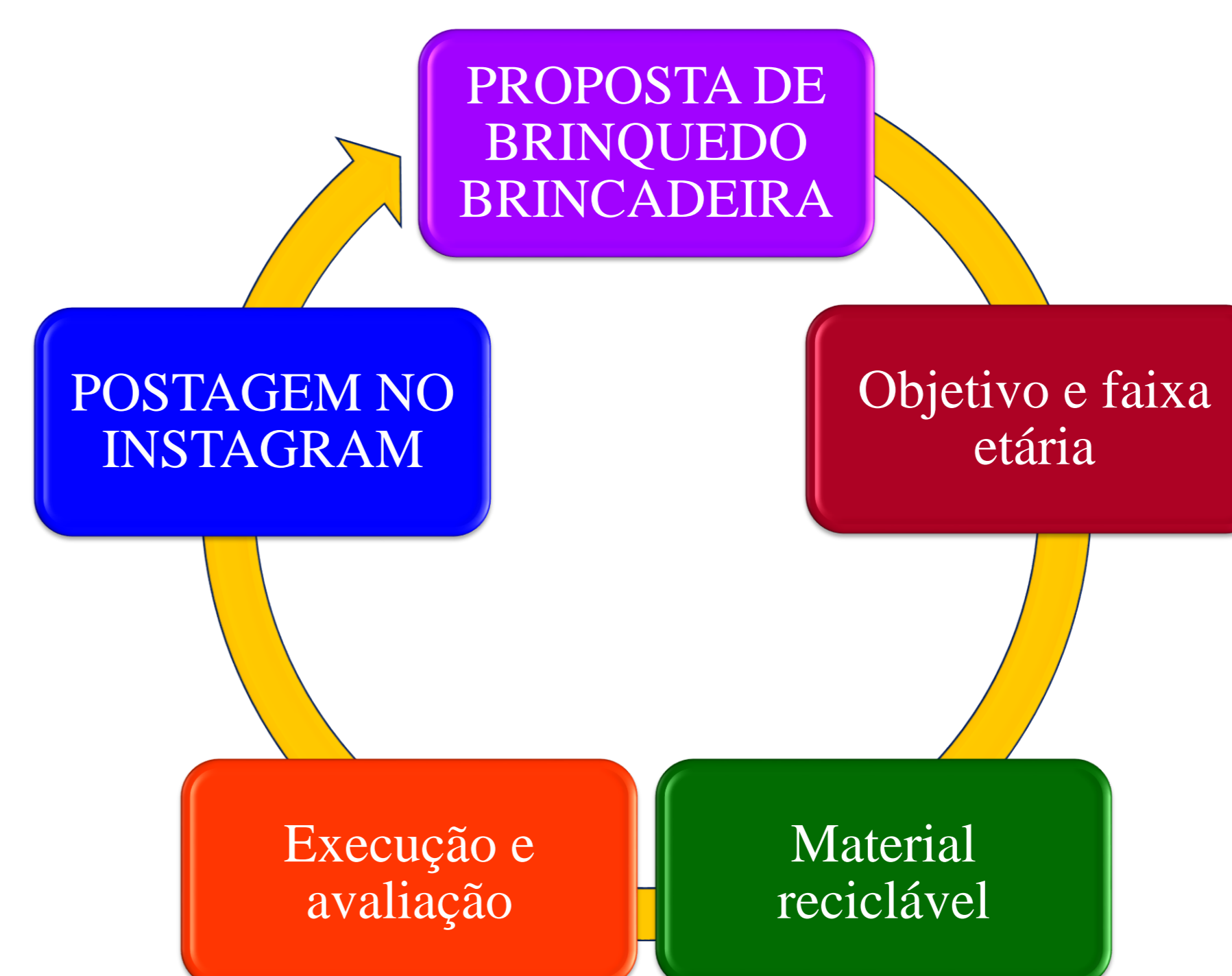
Gráfico 1 Processo de postagem de brinquedo para o Instagram da Ludoteca UFV