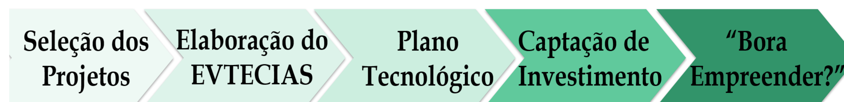
Figura 2: Etapas operacionais do programa “Sua tese, Um negócio”

Para os projetos que demonstrarem viabilidade será atribuído apoio técnico para a criação do Plano Tecnológico, com objetivo de estruturar e amadurecer a ideia através da interação do trinômio Tecnologia, Produto e Mercado (TPM). Com as bases de aplicação tecnológica bem consolidadas, o pesquisador será preparado para o processo de captação de investimentos, por meio de editais de fomento, contatos com fundos de capital semente e empresas. Por fim, o “Bora Empreender?” consiste na tomada de decisão quanto a Empreender, sendo direcionado ao programa de Pré-Incubação do tecnoPARQ ou Valoração Tecnológica, sendo encaminhado para a CPPI auxiliar neste processo, bem como orientar posteriormente quanto ao licenciamento ou transferência da tecnologia para o mercado.