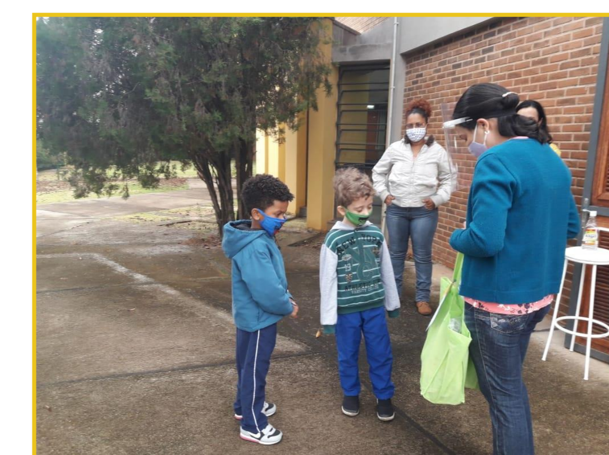
Entrega dos Kits brincantes às crianças e famílias no LDH