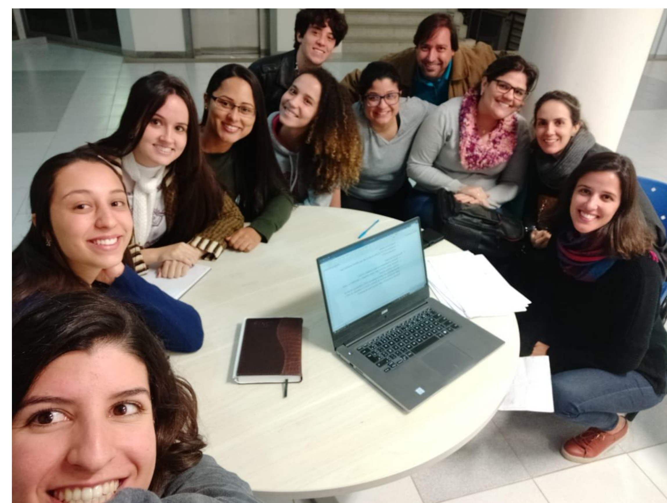
Imagem 2 - Foto do grupo tirada no dia da atividade.

Pode-se dizer que a atividade foi efetiva para reconhecer a importância do trabalho interdisciplinar e conhecer as atribuições de diferentes profissionais da área de saúde.