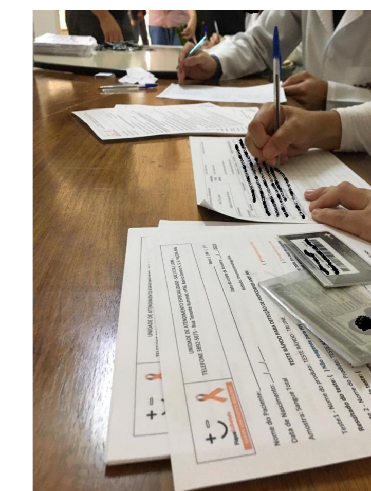
Figura 7: Cadastro dos participantes