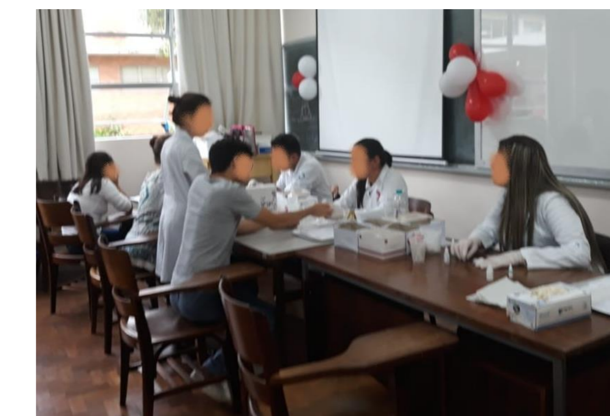
Figuras 4 e 5: Realização dos testes – rostos borrados para preservar o sigilo médico