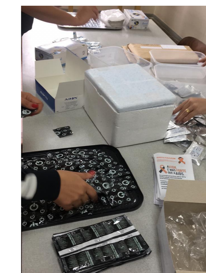
Figura 8: Distribuição de preservativos